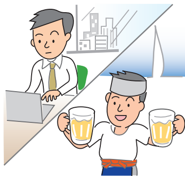
図1 「従たる給与についての扶養控除等の(異動)申告」の対象者

その形態も、正社員やパート・アルバイトだけではなく、会社役員や起業による自営業主など、様々あります。副業や兼業に関する裁判例では、労働者が労働時間以外の時間をどのように利用するかは、基本的に